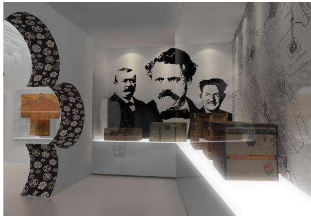
Louis, le fondateur ( au milieu), son fils Georges (à gauche), le fils aîné de Georges : Gaston-Louis (à droite)

Le Musée Carnavalet met en scène l'épopée de Louis Vuitton qui incarne l'art de voyager depuis plus de 150 ans. Nous étions tous très motivés pour venir voir cette exposition qui nous donnait l'occasion de redécouvrir cette marque de maroquinerie haut de gamme dont le monogramme est connu dans le monde entier. Nous avons été enthousiasmés par la beauté de ces malles et bagages de grand luxe qui sont de véritables trésors artisanaux. Au Musée Carnavalet, le célèbre malletier est resitué dans l'histoire culturelle et artistique de Paris (tableaux, photos, maquettes). L'histoire de la famille Vuitton est très liée à l'histoire de Paris.